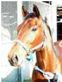
H 8 年生・鹿毛 セン・アラブ

僕の名前はマノノトップガン！ちょっとパクリです。けど、競走成績はアラブのトップガン並みなんだぜ！大きな重賞も勝ってかなりシャシャってたんだから。カッコよかったんだからね。けど、ココに来てからはバンビとかカワイイとか言われてカッコ良かった僕は何処へ行ったのやら・・・。そんな扱いを受けていると、最近カワイイって言われるのも悪くないなって思うんだな。思っきり愛想振りまくっちゃったりしてみんなの気を引こうと必死だよ。以前は先頭を走るのに必死だった自分が、今はかまってもらうのに必死！そんな僕を宜しくね！乗馬に関してはまだまだまだまだ勉強中だけどいつかはみんなを乗せて頑張ってみるんだな！