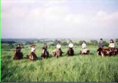
みんな並んで並んで～！！