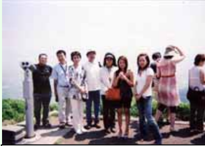
A班B班に分かれて「大観峰」。とても暑かったそうです！！