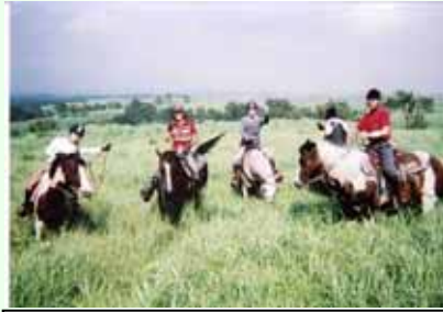
草原の中で「はい、チーズ！！」