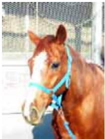
1989年生・ 栗毛セン・サラ

僕の名前はモンテローザ！ムチャクチャ小心者なオジサンさっ！水怖いし、「バディ親分」がいないと外に放牧なんていけないよ。そんな心とは逆に体はマッチョな僕なのさ！！だけでもそれは見せかけで、かわいがってくれる人みんな大好きだから愛想振りまくっちゃうぞ。洗い場で僕を見つけたら声をかけてね！基本的に、普段は金城生等を乗せてハッスルしているよ！たま～～に会員の方にも乗ってもらってるよ！物凄く身体能力は高いから乗ったらビックリするかも。けど、最初に言った通り小心者だから上の人が支えてくれないと心配で心配でパタパタしちゃうんだ。こんなチキンな僕だけどもみんなよろしくね！